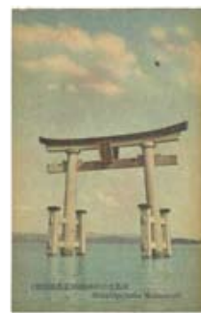
▲白鬚神社

展覧会では、近代に発行された日本の名所を描いた絵葉書や、海外旅行のパンフレットを展示します。併せて絵葉書に描かれた近江の名所の現在の写真も紹介しますので、時代の変化や旅の思い出を懐かしみながらお楽しみください。