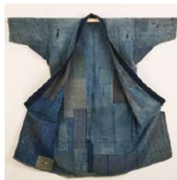
▲長着 / 多賀町山間部 / 個人蔵

日本人の勤勉さと物を大切にする心から生まれた、美しい仕事着のデザインをご鑑賞ください。